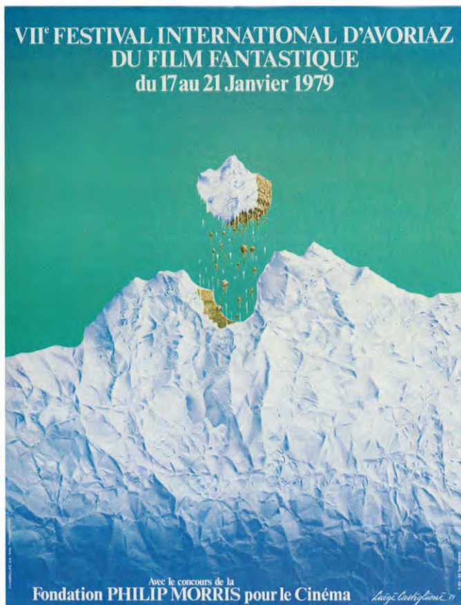
7ème Festival International d'Avoriaz du Film Fantastique, 17 janvier 1979, 63 x 48 cm

Luigi Castiglioni est né à Milan le 20 novembre 1936. A 5 ans déjà, en observant son père, peintre amateur, il se met à dessiner. C'est à l'âge de 14 ans qu'il entre aux Beaux-Arts de Milan : il est le plus jeune élève de l'académie.