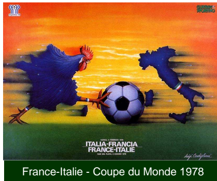
France-Italie - Coupe du Monde 1978