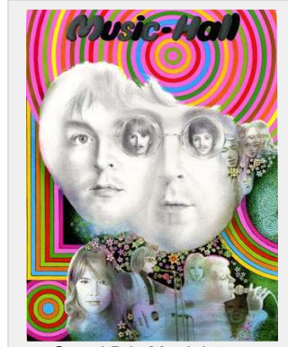
Grand Prix Martini 1969