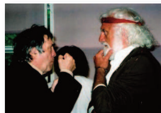
Marcel Cerdan - Daniel Herrero