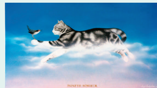
PAPATTE SONGEUR Papatte songeur, 1997