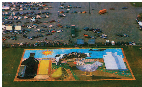
Photo prise d'hélicoptère sur le parking du magasin Carrefour à Evreux

En 1984 Yves, toujours fidèle, a récidivé pour filmer “ Le plus grand tableau vivant du monde ”. Posée sur l'herbe d'un supermarché d'Evreux, cette opéra-bouffe de 2740 m 2 composée de 50 tonnes de victuailles et d'animaux vivants, avait un but pédagogique : montrer tout ce qu'une Française, vivant 79 ans, mange au cours de sa vie, d'après les statistiques INSEE de 1984.